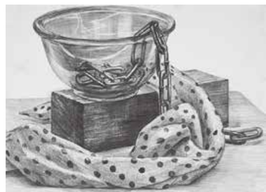
武蔵野美術大学 工芸工業デザイン学科 合格再現