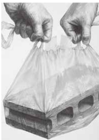
多摩美術大学 グラフィックデザイン学科 合格再現