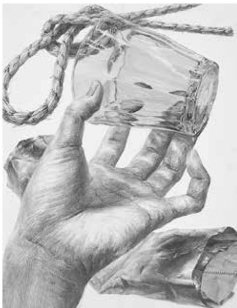
東京藝術大学 デザイン科 合格再現

※カリキュラム内容・画面サイズ・使用画材などは指導の都合上、やむをえず変更する場合がありますので予めご了承下さい。