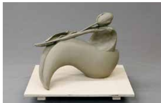
東京藝術大学 工芸科 合格再現

このコースでは私立美術大学に合格するために、各大学に求められている事項に即した課題に取り組みながら、デッサン力・構成力を養っていきます。初心者の人でも『夏から合格』を目標にして、道具の使い方や、テクニック、志望校選択についてなど安心して学べるように個人面接を通して、きめ細かく指導していきます。