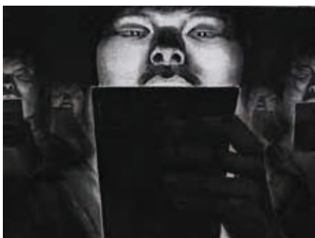
参考作品 構成デッサン