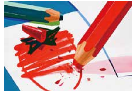
多摩美術大学 プロダクトデザイン専攻 合格再現