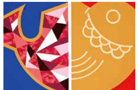
多摩美術大学 統合デザイン学科 合格再現