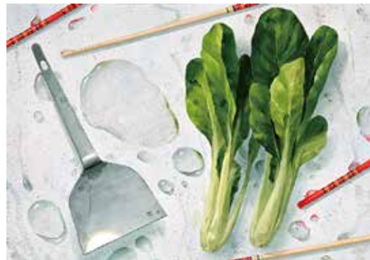
東京藝術大学 デザイン科 合格再現

このコースでは東京藝術大学デザイン科・工芸科と私立美術大学平面・立体系に合格するために、基礎力に磨きをかけながら、様々な課題に対応するの総合力を養っていきます。デッサン力・構成力・発想力・表現力をそれぞれの入試に対応した課題に取り組み「今、何が必要なか?」を具体性をもって指導し養っていきます。※2016年度入試から芸大デザイン科の一次試験のデッサンでは構成が加わり石膏との選択制になったので、構成デッサンにも対応出来るカリキュラムになっています