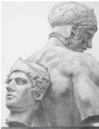
参考作品 石膏デッサン

入試課題を応用したモチーフによる課題構成で、芸大、私大入試に幅広く対応できる表現力を身に付けます。時間をかけて取りくめる課題や少ないモチーフを短時間で描き切る課題を時間をかけて取り組むことで描き出しから最後のプロセスまでを確認しながらレベルの高い描写力を習得します。