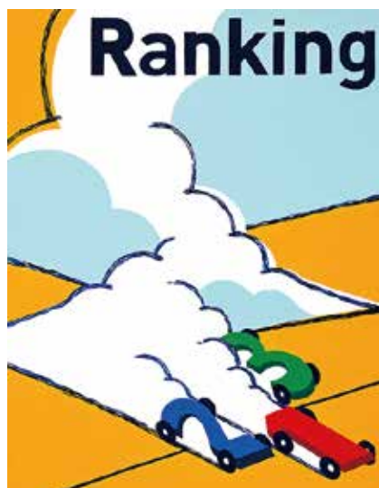
多摩美術大学 グラフィックデザイン学科 合格再現

※アクリル絵具、透明水彩絵具は24色以上が望ましい。 ※立体構成で使用する各種素材は指定の物を購入すること。