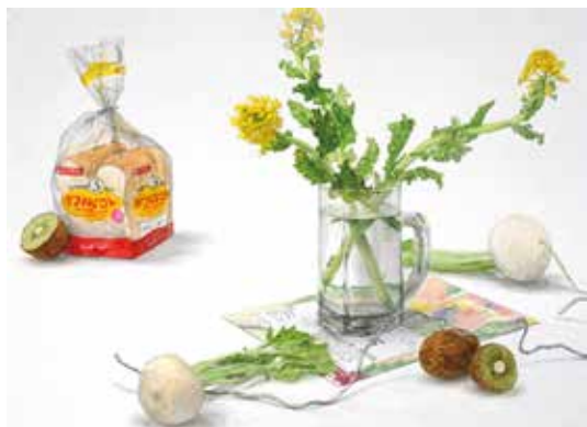
参考作品 静物着彩