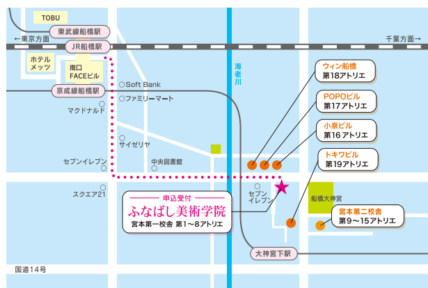
● JR総武線船橋駅南口・東武野田線船橋駅・京成線船橋駅より徒歩15分 ● 京成線大神宮下駅より徒歩5分

本学院では、申込書に記入いただいた個人情報は厳重に管理・取扱いを行い、下記の利用目的以外では一切使用致しません。また、取扱いを外部に委託することも致しません。 【利用目的】 授業に関わる情報や通知などの連絡、送付・本人と特定されない方式での統計資料の作成。