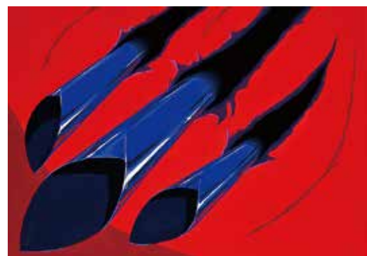
武蔵野美術大学 視覚伝達デザイン学科 合格再現

このコースは私立美大の入試課題を攻略するための特訓コースです。発想から作品への展開力や構成力、安定したデッサン力を養っていきます。各自の目標に合わせて、課題を選択することが出来ます。近年の入試では、幅広い発想力と表現力が求められているので、それに対応出来る実力を身につけられるように丁寧に指導していきます。※選択する課題などの相談にも随時応じます。