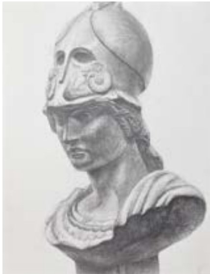
石膏デッサン [ 木炭紙大画用紙・鉛筆 ]