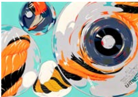
参考作品 [色彩構成]