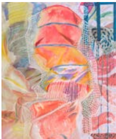
参考作品 [絵画表現]