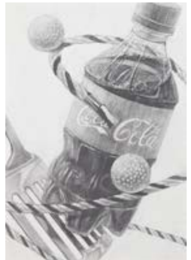
構成デッサン [ B3画用紙・鉛筆 ]

講評会は、制作した作品に対して講師が「長所や短所」「これからのテーマ」などの確かな指摘とアドバイスを与えます。また、他の人の作品と並べて観ることのできる大切な機会でもあります。