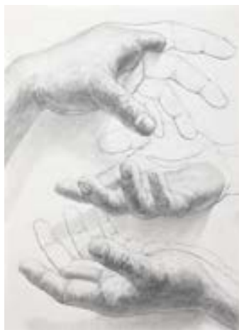
参考作品【構成デッサン】