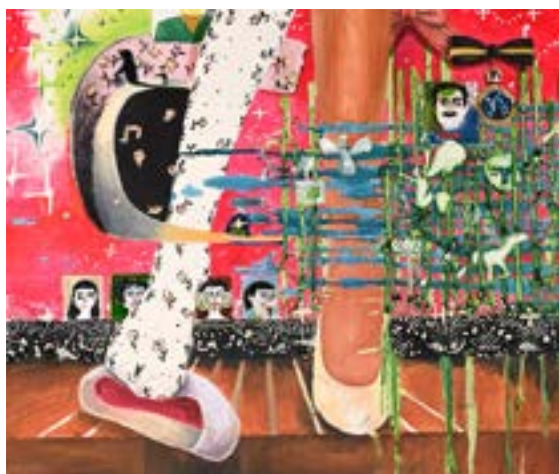
参考作品 [絵画表現]