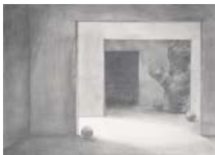
多摩美術大学 日本画専攻 合格再現