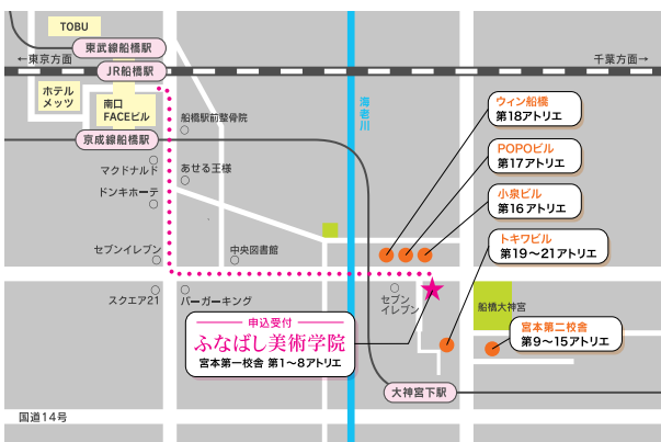
●JR総武線船橋駅南口・東武野田線船橋駅・京成線船橋駅より徒歩15分 ●京成線大宮下駅より徒歩5分

※2024年度本学院生は受講料が上記から減額されます。 ※上記入学金・受講料は全て消費税を含む総額となります。(内税)