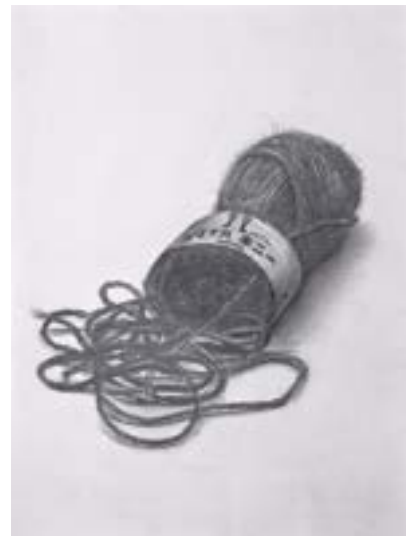
武蔵野美術大学 映像科 合格再現 (デッサン)

※カリキュラム内容・画面サイズ・使用画材などは指導の都合上、やむをえず変更する場合がありますので予めご了承下さい。