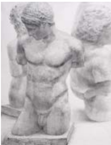
参考作品 [石膏静物デッサン]