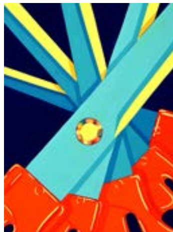
武蔵野美術大学 空間演出デザイン学科 合格再現