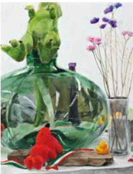
静物着彩 [ 木炭紙大画用紙・アクリル絵具 ]