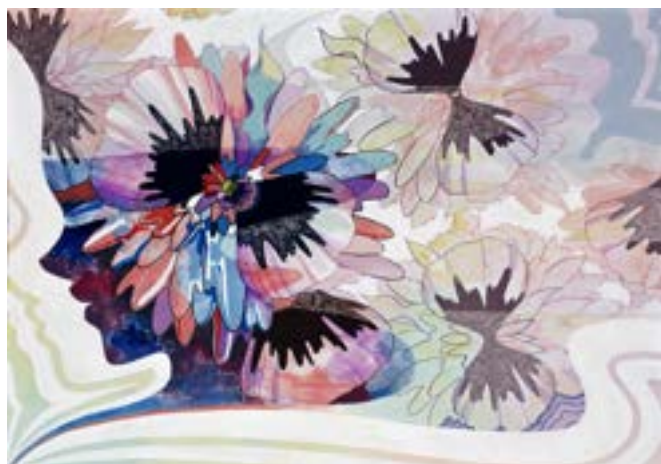
東京藝術大学 デザイン科 合格再現