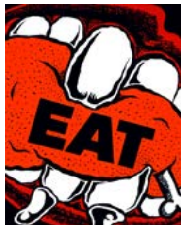
多摩美術大学 グラフィックデザイン学科 合格再現