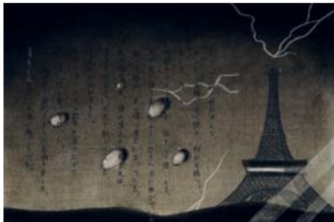
武蔵野美術大学 映像科 合格再現 (イメージデッサン)

※カリキュラム内容・画面サイズ・使用画材などは指導の都合上、やむをえず変更する場合がありますので予めご了承下さい。