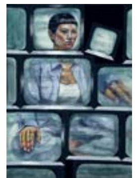
武蔵野美術大学 日本画学科 合格再現