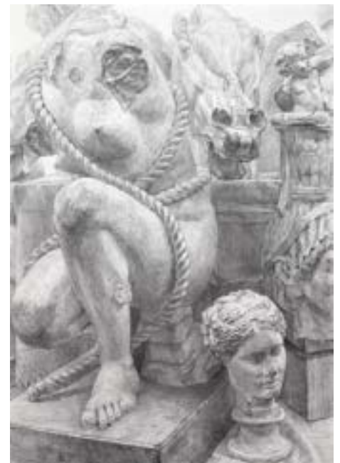
参考作品 [大静物デッサン]